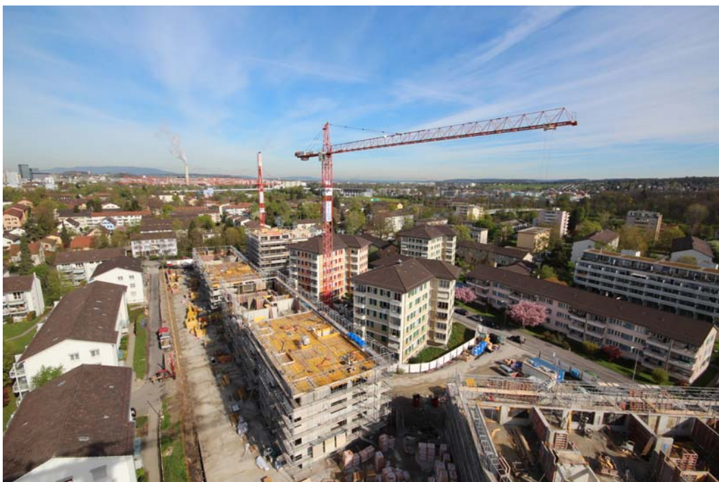
Baustelle Luegisland Süd, Ende April 2012, vom Kran aus gesehen

Jahresrechnung (Bilanz und Betriebsrechnung) Verwendung des Betriebsgewinnes