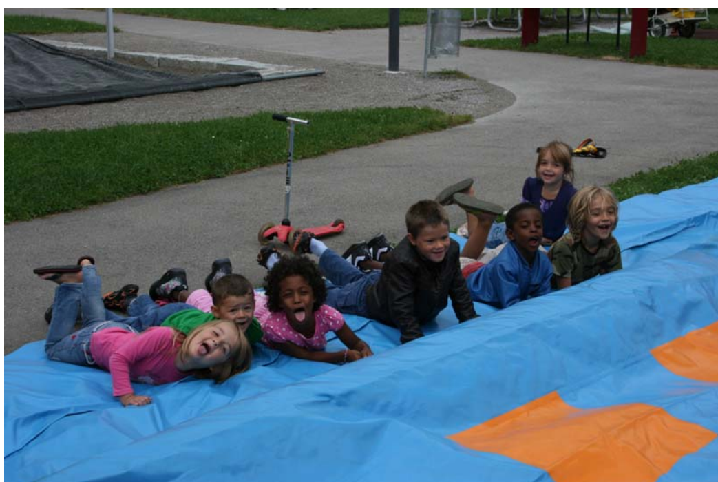
....Hüslifest Kronwiesen am 27.08.11