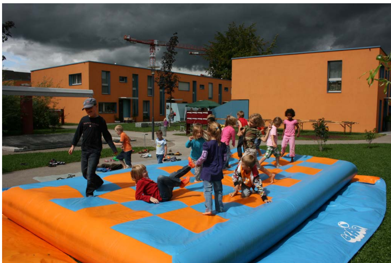
Trotz Wolken ausgelassene Stimmung beim .....