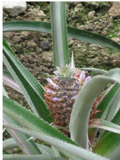
Bananenstaude und Ananaspflanze im Tropenhaus Wolhusen, Altersausflug 17.05.11 (Titelbild: Baustelle Luegisland Süd Ende 2011)