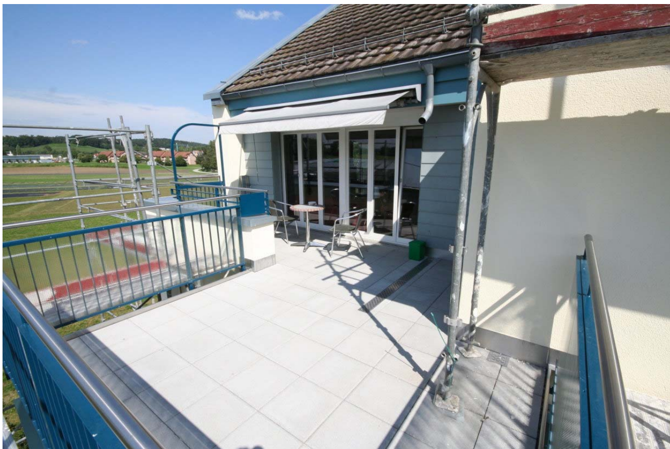
Balkonerweiterung Dachwohnungen Wiesenstrasse in Schwerzenbach

Seit Schulbeginn August 2011 wurde der Kindergarten Wiesenstrasse 17 von den Schulbehörden bis auf weiteres an einen Tageshort untervermietet. Dies, weil der Kindergarten Wiesenstrasse zur Zeit in Schwerzenbach nicht mehr benötigt wird. Zu einem späteren Zeitpunkt soll er aber wieder in Betrieb genommen werden, weshalb die Schulbehörde ihn auch nicht kündigen möchte. Durch den Betrieb des Kinderhortes entstehen andere und stärkere "Immissionen" als bei einem Kindergarten. Wir hoffen aber auch hier auf das Verständnis der Genossenschafter, denn die Gemeinde Schwerzenbach und viele Eltern sind auf solche Horte angewiesen.