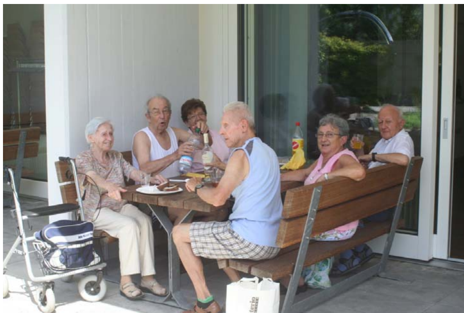
Fröhliche Stimmung beim Grillfest des Seniorenforums am 22.08.11 beim Mehrzweckraum