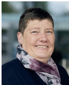
Anouk Egle Reinigung