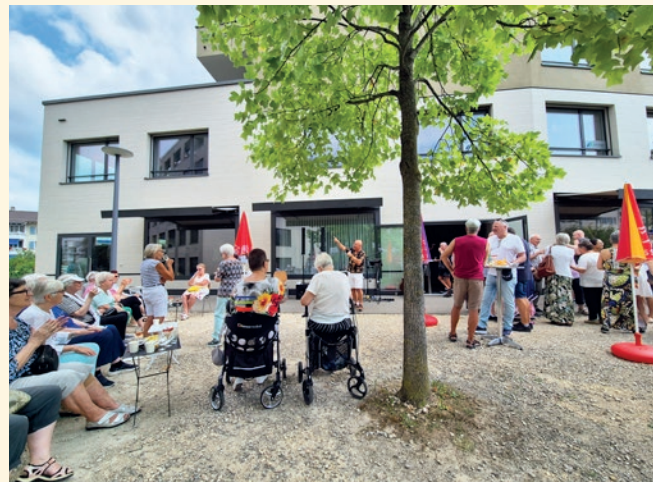
Oben und unten links: Ausflug zur Mostbäuerin.