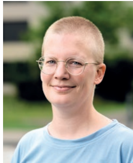
Cécile Reiser Kommunikation, Bewirtschaftung